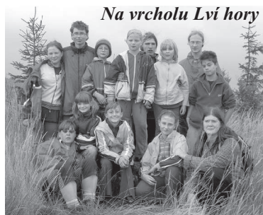
Na vrcholu Lví hory

Počasi nám přálo, a proto byl letošní tábor více zaměřen na turistiku a poznávání Rychlebských hor a Jeseníků. Při táborových výletech jsme vystoupali na nejvyšší vrchol Rychlebských hor Smrk (1125 m n. m.), zdolali jsme i druhý nejvyšší vrchol Lví horu (1040 m n. m.), přešli jsme Polský hřeben plný dozrávajících borůvek, prošli jsme údolí Stříbrného potoka,