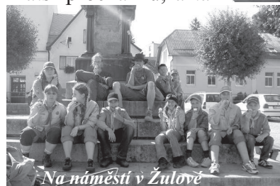
Na náměstí v Žulové

j jsme na konci tábora zjistili, že jsme za 14 dní nachodili úctyhodných 102 km!