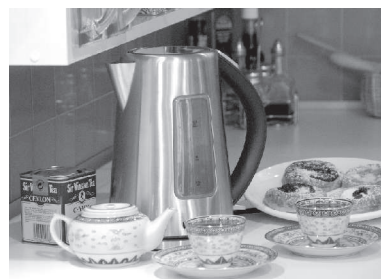
I moderní rychlovarná konvice může šetřit rozpočet domácnosti

Společnost ELEKTROWIN a.s. vybuodovala v České republice pro občany síť míst, kde je možné vysloužilé elektrozařízení odložit s průměrnou dostupností 3900 obyvatel. Dnes jejím prostřednictvím pokrývá města a obce, ve kterých žije přes 87 % obyvatel ČR. Sběrná místa jsou vytvořena především ve sběrných dvorech měst a obcí a u prodejců elektrozařízení. Sběrných dvorů je ke konci roku 2008 zapojeno více než 600 ve 440 městech, prodejců 2200 prodejen elektrospotřebičů a sběr probíhá také prostřednictvím mobilních svozů, které jsou smluvně zajištěny ve více než 4000 obcích.