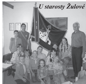
U starosty Žulové

vykoupali jsme se v Nýznerovských vodopádech. Došli jsme také do Žulové, vzdálené od našeho srubu 11km, kde jsme strávili celý den hrou „Poznej město Žulová“. Starosta města Žulová nás osobně provedl výstavou „750 let od založení Žulové“. Každý den jsme měli výlet nebo alespoň kratší procházku, a tak