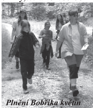
Plnění Bobříka květin

Letošní celotáborová hra, která byla připravená podle knihy Jaroslava Foglara „Hoši od Bobří řeky“, nesla název „Lov bobříků na Stříbrném potoce“. Dvě skupinky dětí „lovily bobříky“, resp. plnily zkoušky a úkoly, aby získaly pomyslnou „kuži bobra“, určité hodnoty a učitě barvy. „Bobříky“ představovaly nabarvené látkové knoflíky, které si děti navlékaly na šňůrku jako korálky. Někteří nosili „své ulovené bobříky“ na krku, jiní si je pověsili v chatě na zeď. Někteří zkoušky si splnil každý individuálně, např. bobříka hladu, mlčení, odvahy, síly a bobříka ledňáčka. Jiné jsme plnili společně, třeba bobříka mrštnosti při táborové olympiádě, bobříka poznávání květin během výletu na Paprsek nebo bobříka turistu během táborových výletů.